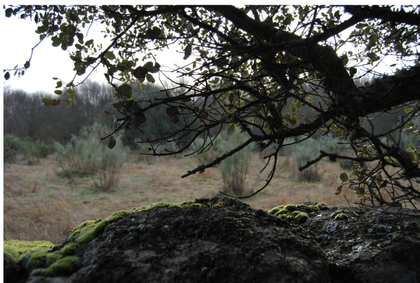
El tratado de Guisando

En la entrada leemos la siguiente inscripción: